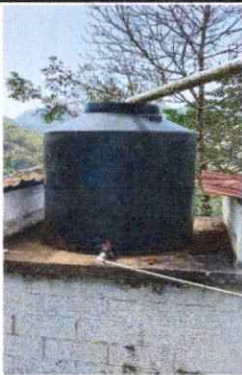
Foto 3: Se observa el deterioro y el mal estado del deposito de agua