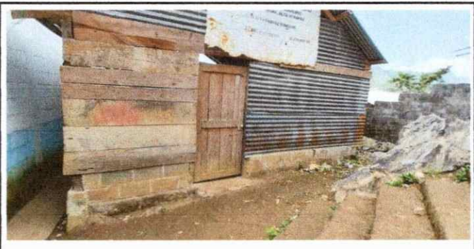
Foto 6: Se observa deterioro y el mal estado del modulo 2, continuacion de paredes

Observación: Si es necesario se pueden agregar hojas adicionales y actualizar el número de hojas.