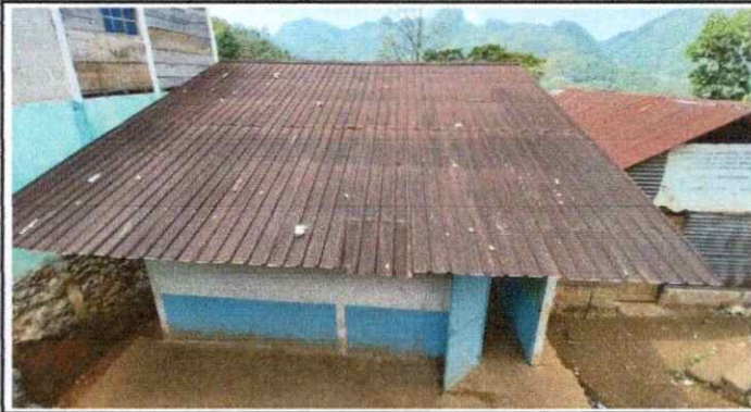
Foto 1: Se observa el deterioro de la estructura de techo y desprendimiento pintura en las paredes del modulo 1