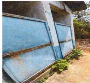
Foto 4: Se observa el deterioro y el mal estado las puertas del baño