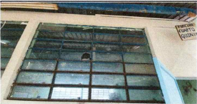
Foto 5: Se observa en area de ventana piezas de vidrios quebrados y en mal estado.